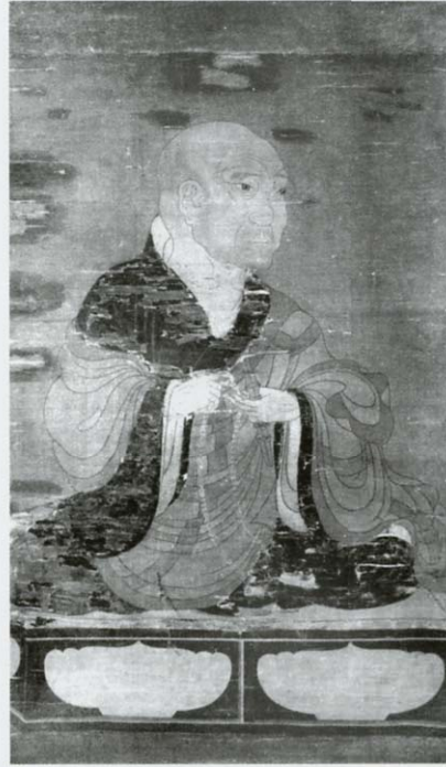
■ 絹本着色慈恵大師像 室町時代 横川元三大師堂蔵