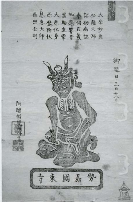
■ 木版墨摺角大師像 江戸時代 京都・龍谷大学大宮図書館蔵