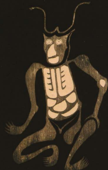
■ 木版墨摺角大師像(部分) 江戸時代 延暦寺一山寺院蔵