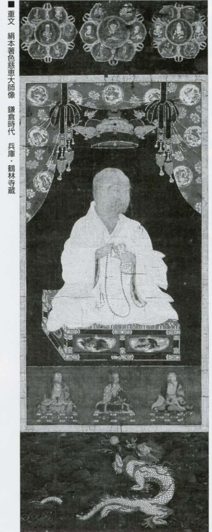
■ 重文 絹本着色慈恵大師像 鎌倉時代 兵庫・鶴林寺蔵