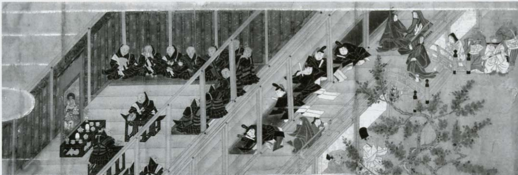
■ 元三大師縁起絵 南北朝時代 求法寺蔵

近江に生まれ、平安時代に活躍し、比叡山中興の祖と仰がれる良源(912～985)は、元三大師・慈恵大師・角大師・豆大師など様々な名で呼ばれる高僧です。その超人的な業績は、後の人々から観音の化身、権化(仏が人々を救うため、人間の姿を現れること)の人と呼ばれ、厚い信仰が今も生きています。本年は、良源が歿して1025年の節目にあたります。本展は、良源の業績や元三大師信仰によって生まれた作品を一堂に会し、近江が生んだ偉大な高僧の全貌を紹介しようとするものです。