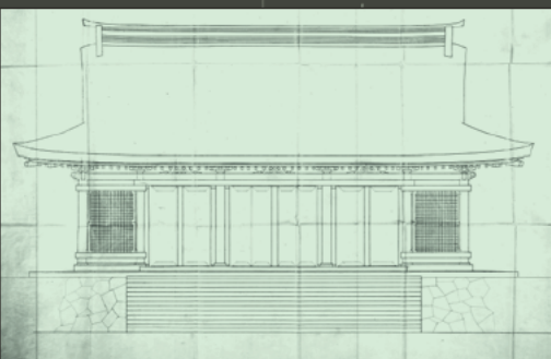
近江神宮内拜殿正面図