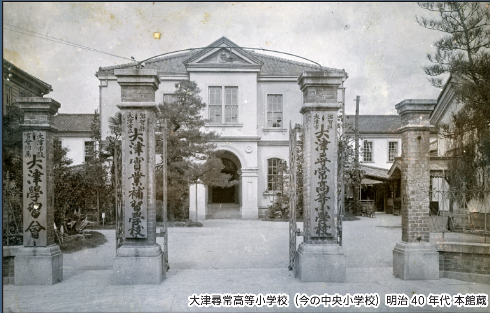
大津尋常高等小学校（今の中央小学校）明治40年代 本館蔵