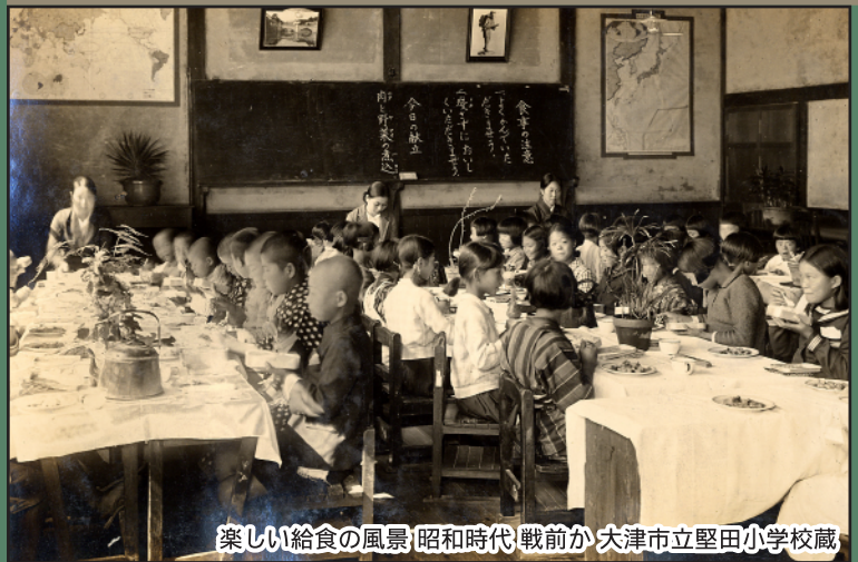
楽しい給食の風景 昭和時代 戦前 大津市立堅田小学校蔵

開館時間：9時~17時(入場は16時30分まで) 休館日：月曜日、2月24日(金) 会場：津市歴史博物館 常設展示室内 ミニ企画展コーナー【有料】