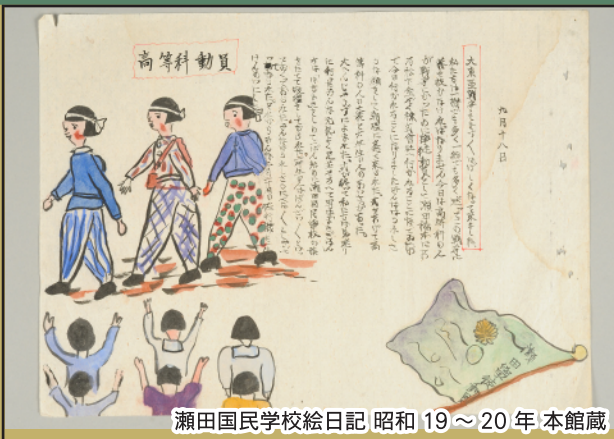
瀬田国民学校絵日記 昭和19~20年 本館蔵

令和5年(2023)は、津市の多くの小学校の創立年である明治6年から150年の節目の年です。本展では、学校に関わる歴史資料や古写真から、明治~昭和の学校の様子を紹介します。