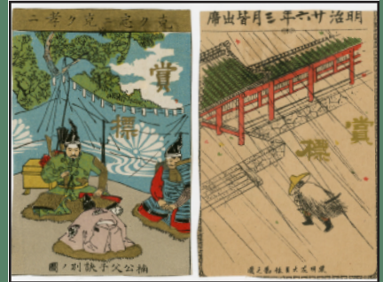
雄琴尋常小学校の皆勤賞 明治20年代 本館蔵