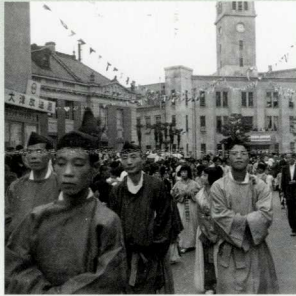
市制60周年記念パレード(市役所前) 昭和33年

市制120周年を記念し、大津市が還暦を迎えた昭和33年頃の様子を振り返ります。この頃の大津は、キャンプ大津の返還を境に都市基盤整備が本格的に始まり、湖岸の埋め立てや道路建設などによって、今の大津の風景や生活の土台がかたち作られました。本展では、古写真や資料から、これらの移り変わりを紹介します。