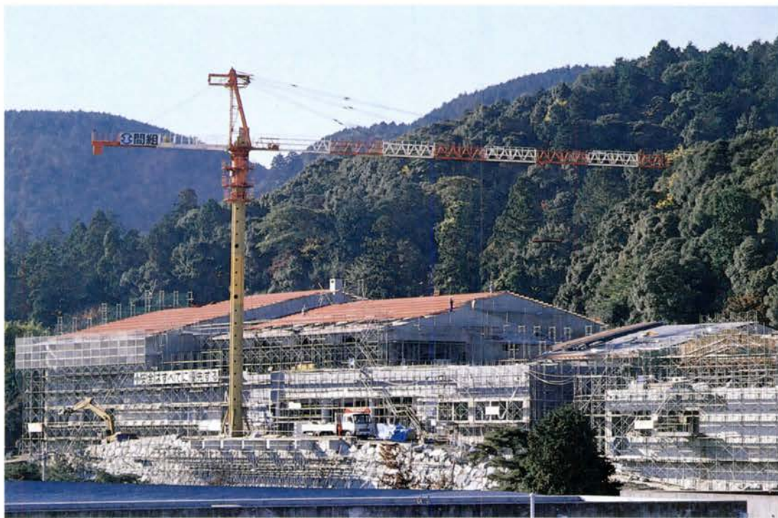
＜(仮称)大津市歴史博物館(左)および大津市立市民文化会館(右)新築工事＞