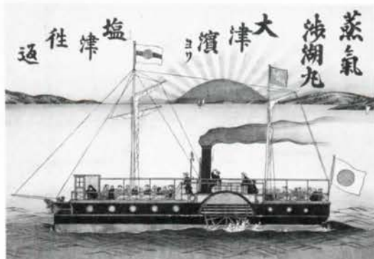
蒸気船涉湖丸の錦絵 (展示資料から) 煙をたなびかせて、琵琶湖をさっそうと走る蒸気船は近代の幕開けのシンボルであった。

また、歴史年表展示は、大昔の原始時代から、つい最近まで、大津市で起こった出来事を、実物資料とイラスト、写真パネルなどをふんだんに盛り込んで、楽しく紹介しようと考えています。テーマ展示をヨコ系とすれば、歴史年表展示はタテ系