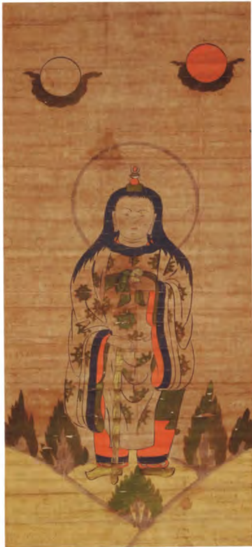
購入1 大津絵 雨宝童子