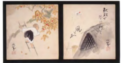
受贈 2 雑画色紙 柴田晩葉筆