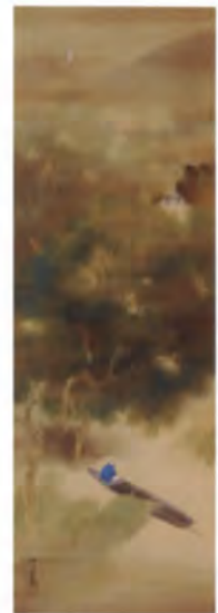
受贈 1 月下漁舟図 柴田晩葉筆