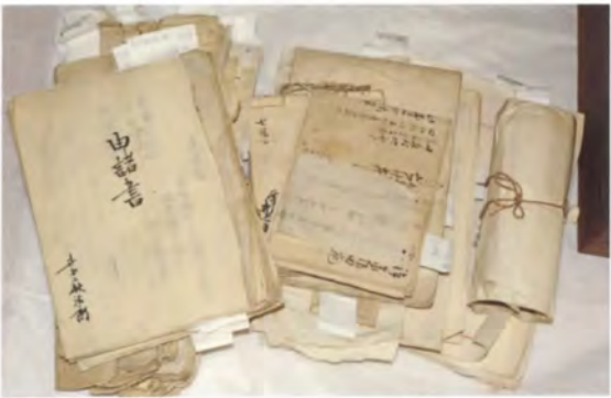
受贈 3 餅九蔵関係資料