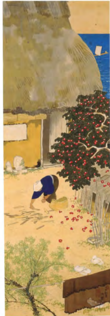
購入3 流木 柴田晩葉筆