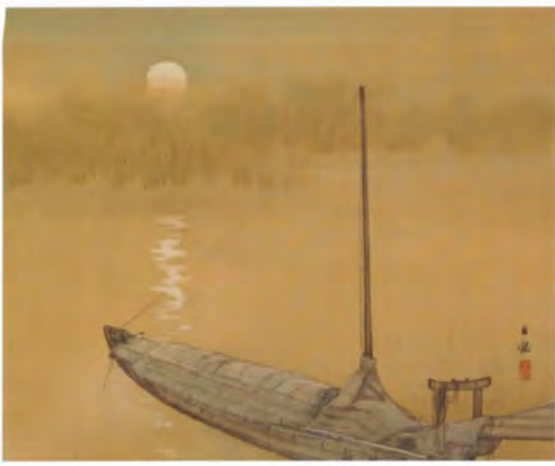
購入 4 丸子船朝敦図 渡辺公観筆