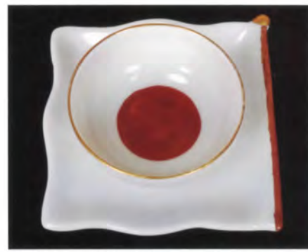
受贈 4 昭和天皇御大典記念 国旗盃