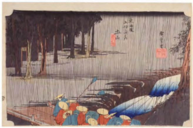
購入 2 保永堂板 東海道五十三次 土山 歌川広重画