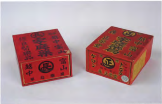
受贈 5 富山売菓置菓箱