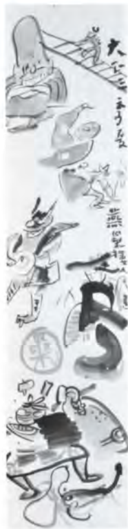
六種大津絵図 富田溪仙 白澤庵蔵