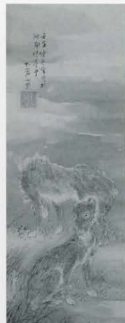
秋野双狼図(部分) 紀樞亭筆 本館蔵