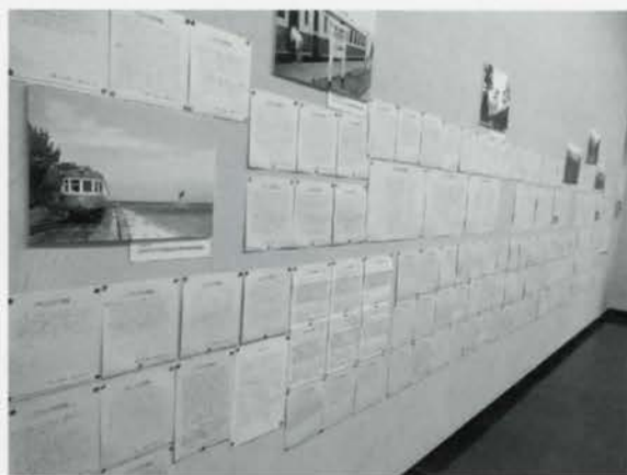
壁いっぱいになった思い出メモ