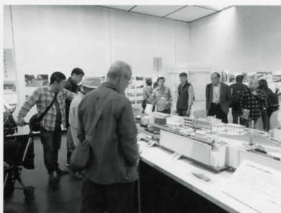
模型の周囲が一番賑やかでした