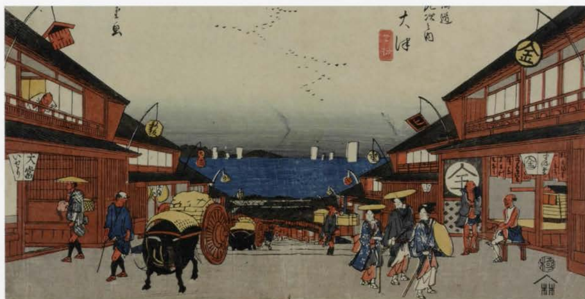
上：広重の名所風景版画の傑作！【保永堂板】近江八景之内瀬田夕照（部分） 個人蔵