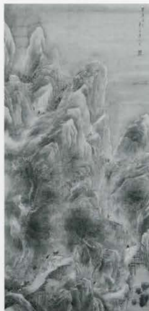
蜀道積雪図 横井金谷筆 本館蔵

兩人に共通するのは、ひとえに、人物も作風も非常にユニークだという点です。蕪村風の作品以外に、個性あふれる作品が多く、海外にも多数の作品が渡っています。本展では、単なる蕪村の弟子・追随者にとどまらない、現代感覚にも通じる彼らの文人画世界を紹介いたします。