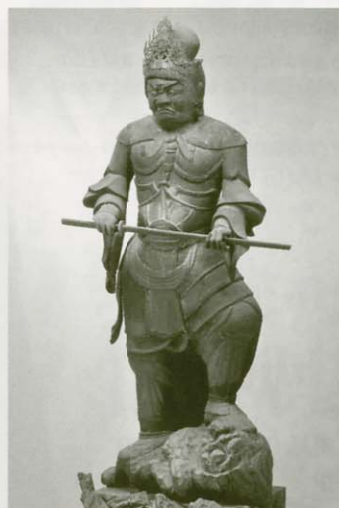
木造四天王立像（持国天） 若王寺蔵