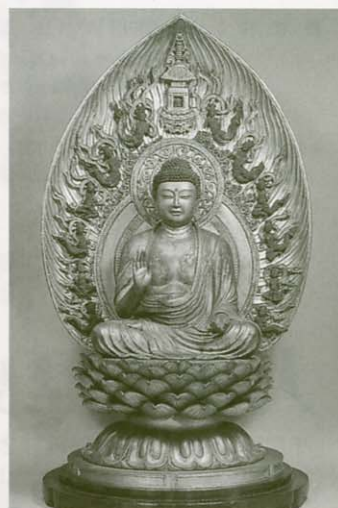
重要文化財 木造釈迦如来坐像 円福院蔵