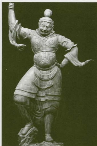
重要文化財 木造四天王立像（増長天） 宇治田原町・禪定寺蔵