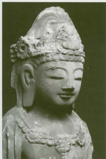
重要文化財 銅造観音菩薩立像 (木造如意輪観音像胎内仏) 石山寺蔵

本展では、このように日本仏教の重要な地域の一つであるこの地にスポットを当て、今は忘れ去られている近江と南都の親密な交流を、現存する仏像をとおして辿ろうとするものです。