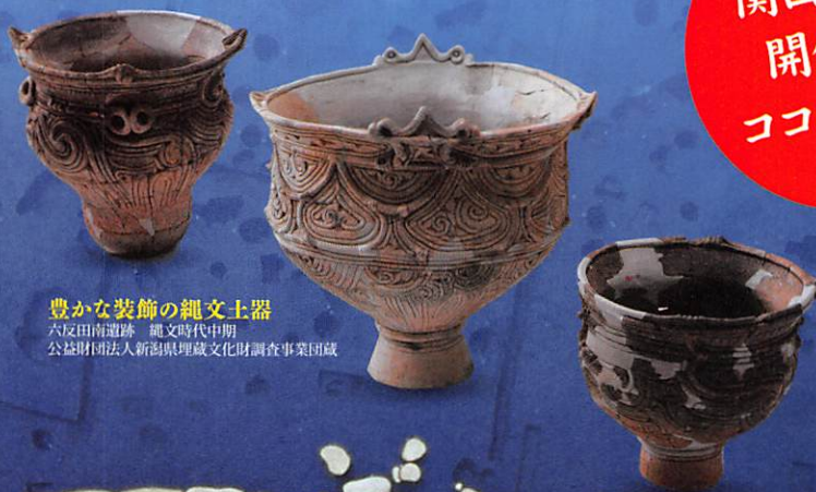
豊かな装飾の縄文土器 六反田南遺跡 縄文時代中期 公益財団法人新潟県埋蔵文化財調査事業団蔵