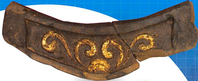
秀吉の城を飾った金箔瓦 伏見城跡 安土桃山時代 京都市文化市民局文化芸術都市推進室文化財保護課蔵

日本全国では、年間約8,000件の発掘調査が行われています。各地で、日々新たな資料が発見され、整理作業が進められています。本展は、近年の調査成果とその出土品をまとめて紹介する全国巡回展です。旧石器時代の狩猟キャンプ地に残されていた石器や、東北地方の豊かな縄文文化、そして近代のビール貯蔵所まで、各時代の全36遺跡を紹介します。