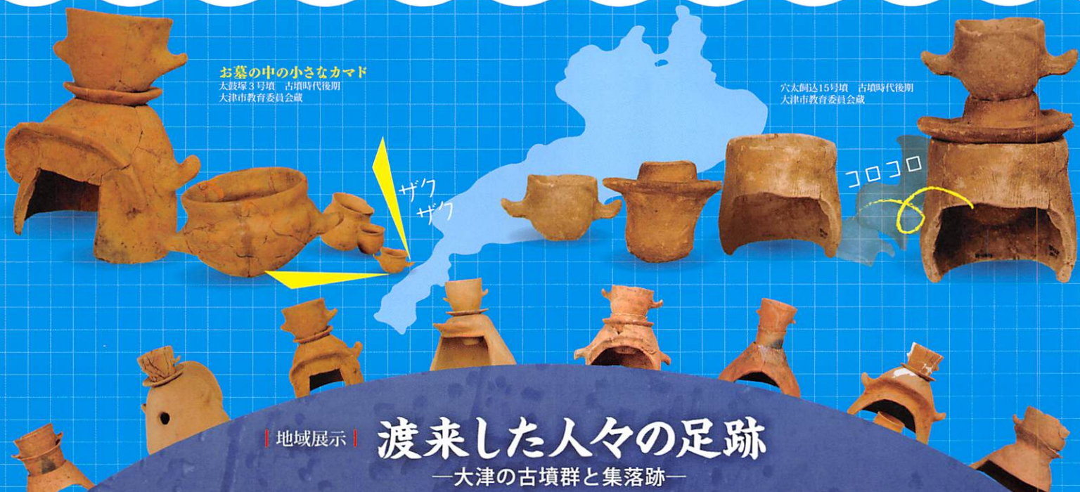
お墓の中の小さなカマド 大鼓塚3号墳 古墳時代後期 大津市教育委員会蔵