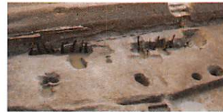
渡来人が建てた? 大壁建物 南滋賀遺跡 古墳時代後期