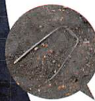
死者に供えた かんざし 穴太野原古墳群 古墳時代後期 大津市教育委員会蔵