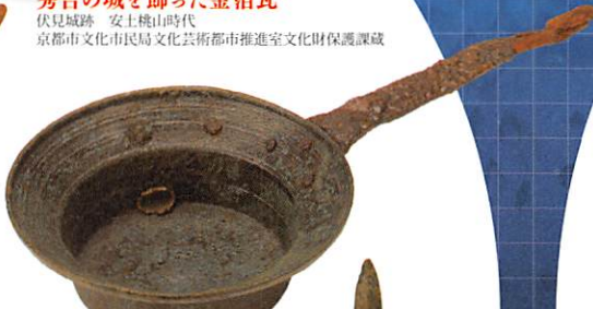
古代のアイロン 火熨斗 神屋遺跡 平安時代 公益財団法人茨城県教育財団蔵