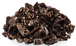
石器の材料 黒曜石の原石 史跡 星ヶ塔黒曜石原産地遺跡 縄文時代 下諏訪町教育委員会蔵