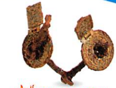
騎馬文化を示す馬具 (重要文化財) 新開1号墳 古墳時代(5世紀中頃) 滋賀県立安土城考古博物館蔵