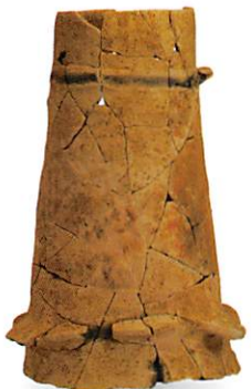
カマドの煙突? 筒形土製品 坂本里坊遺跡 古墳時代後期 大津市教育委員会蔵