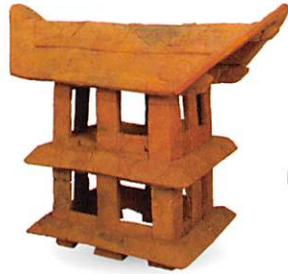
墳頂に並ぶ家形埴輪 史跡 甲立古墳 古墳時代前期末 安芸高田市教育委員会蔵