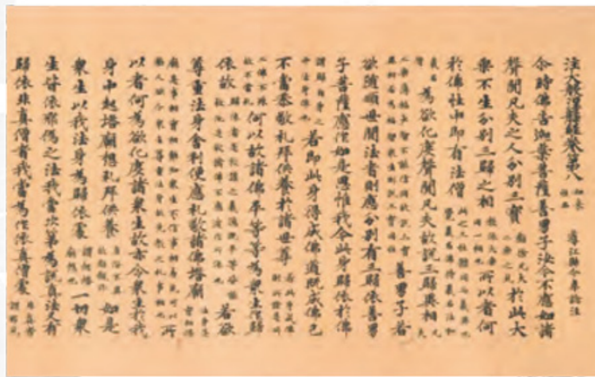
注大般涅槃経卷第八 奈良時代 重要文化財