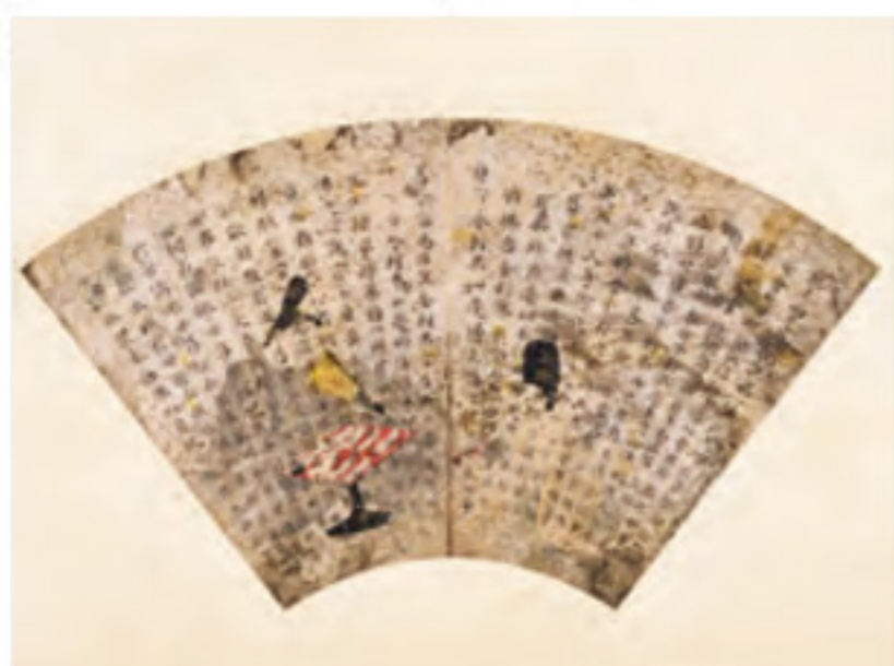
扇面法華経 平安時代 重要文化財