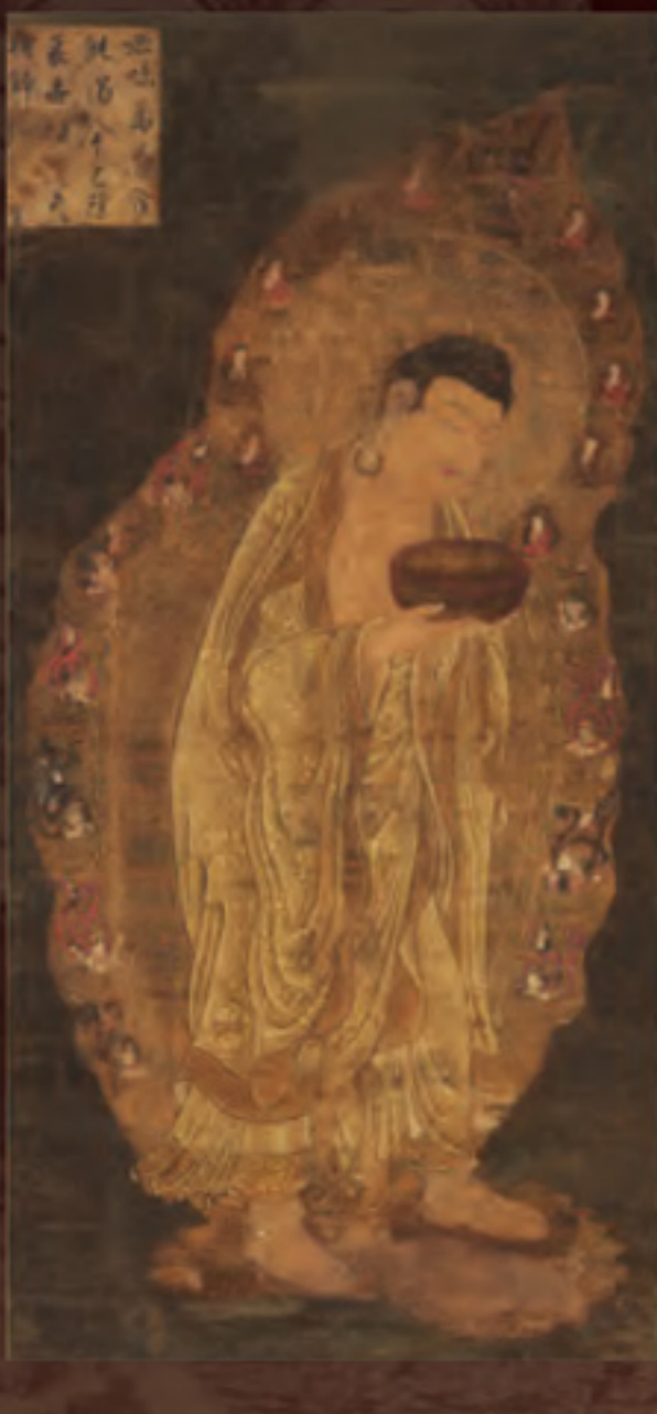
重要文化財 釈迦如来像 鎌倉時代