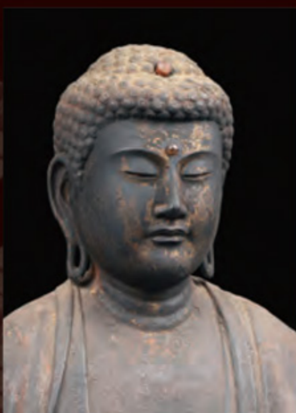
大津市指定文化財 阿弥陀如来立像 鎌倉時代