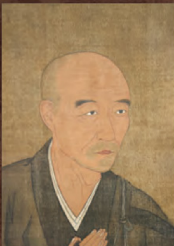
滋賀県指定文化財 真盛上人像 室町時代