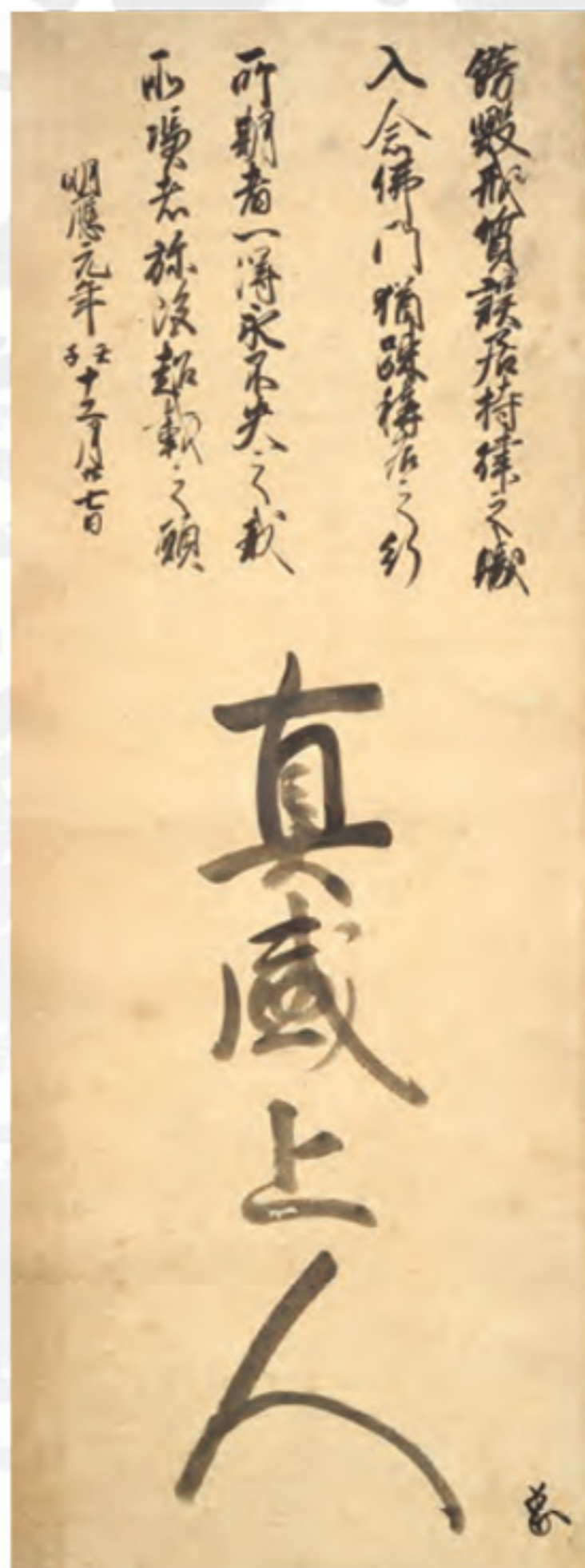
後土御門天皇宸翰真盛上人号 室町時代 重要文化財