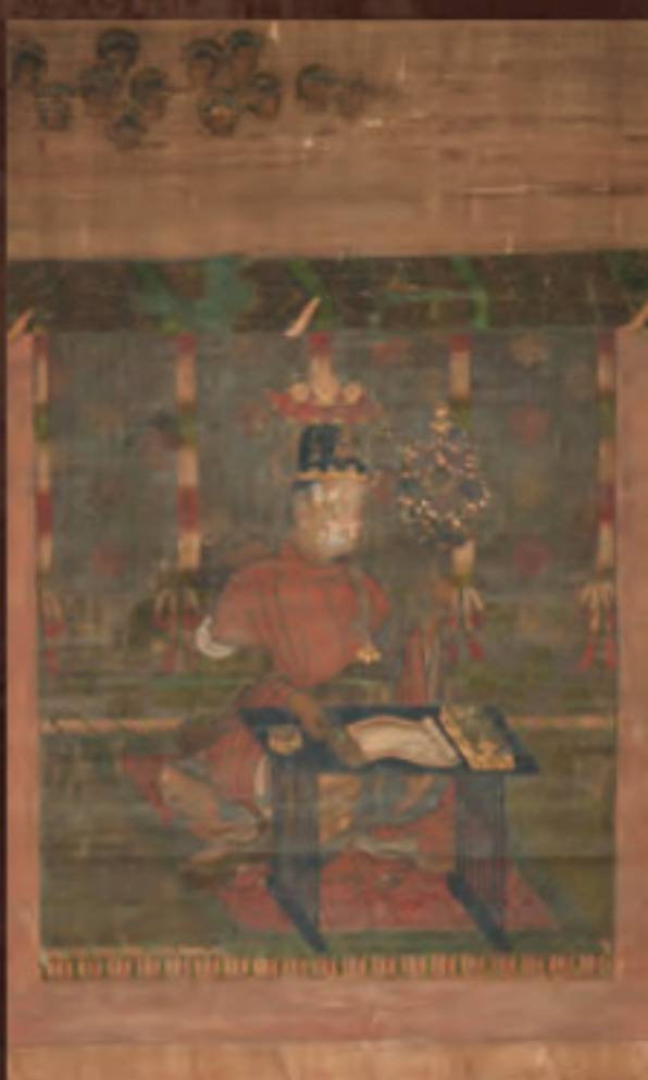
聖徳太子勝鬘經講讃図(初出陳) 室町時代