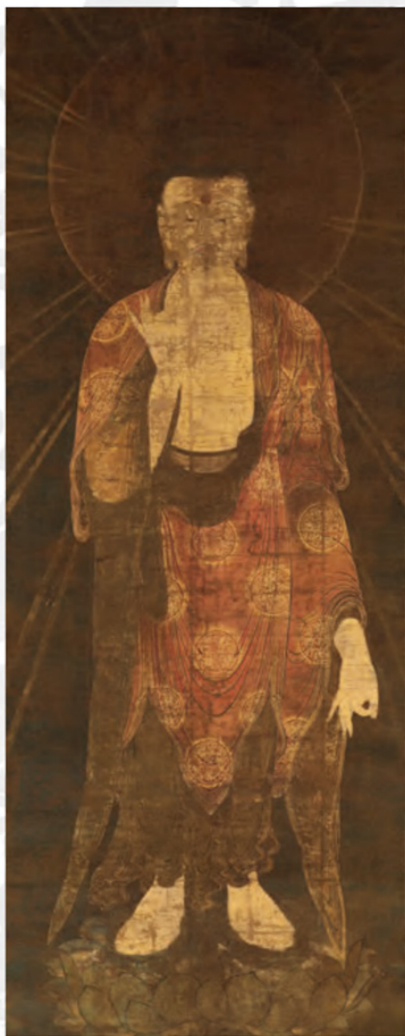
阿弥陀如来像 鎌倉時代 重要文化財

※重要文化財17件、県指定4件、市指定2件、重要美術品1件を含む約160件（約200点）の宝物を展示予定。