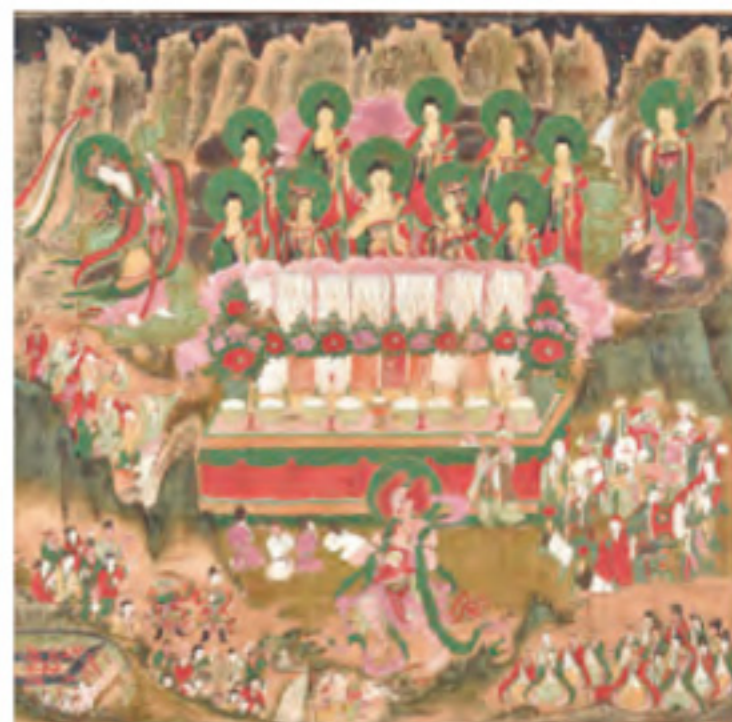
甘露図 朝鮮時代・宣祖24年（1590）

【表写真(中央)】観経变相図 鎌倉時代 重要文化財 【裏背景】十念号 真盛上人筆