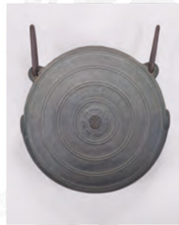
罌口 鎌倉時代 重要文化財