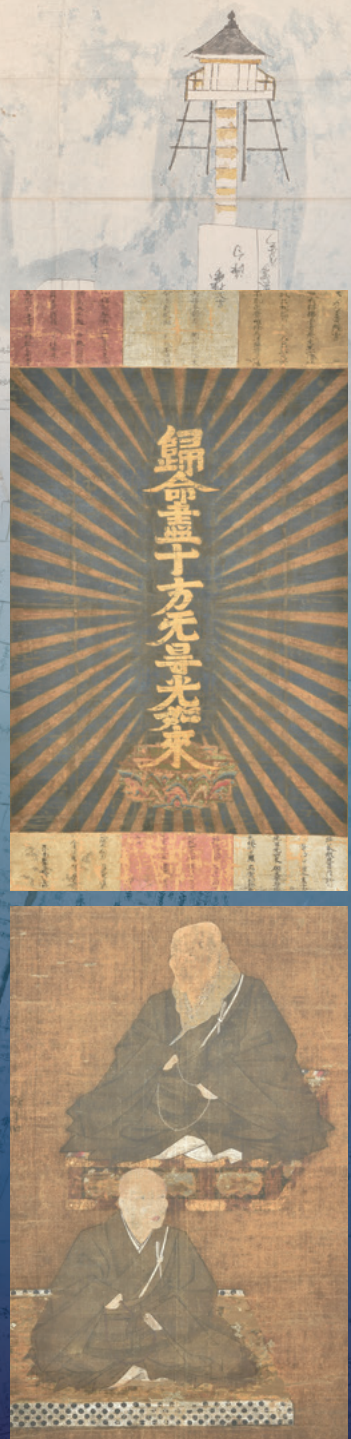
右上:十字名号(登山名号) 室町時代 本福寺蔵 右下:親鸞・蓮如連坐像 室町時代 本福寺蔵 左:大津市指定文化財 本福寺旧記(中世記録) 室町時代 本福寺蔵 背景:本堅田村延宝検地図 江戸時代 伊豆神社蔵